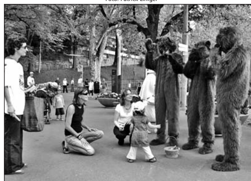
Der Bär: Ein beliebtes Sujet in Berner Politik- Kampagnen...

Nach dem erfreulich deutlichen Abstimmungsergebnis (65.15 % Nein) kann sich «Läbige Stadt» über den ersten grossen Erfolg im Jahr 2008 freuen. Zwei Drittel der Berner Stimmberechtigten liessen sich keine grüne Pseudoidylle vor dem geplanten Parkhaus vorgaukeln und fielen nicht auf die Verheissungen des Initiativkomitees herein. Der Widerstand von «Läbige Stadt», VCS, WWF, Pro Velo und den rot-grünen Parteien hat sich ausgezahlt. Highlight aus der Sicht von «Läbige Stadt» war die Aktion am Pfingstmontag, 12. Mai 2008, vor dem Bärengraben. Die friedliche Demonstration der drei Bären, die dank einem Aargauer Kostümverleih wie echt aussahen, bescherte uns eine erfreuliche Medienpräsenz. TeleBärn und «20 Minuten» waren vor Ort und berichteten über den «bärenstarken» (O-Ton TeleBärn ) Auftritt von «Läbige Stadt» im Tierkostüm.