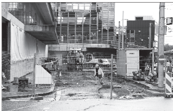
Bahnhofplatz Bern: Umbau als Chance für einen autofreien Platz? (siehe Seite 4)

Mehr zu unseren Aktivitäten im Jahr 2006 ist im Jahresbericht auf www.laebigistadt.ch nachzulesen.